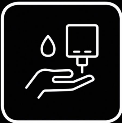
Allgemeine Hygieneregeln immer beachten Follow the general hygiene rules