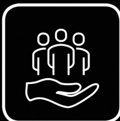
Eigenverantwortung für sich und die Familie Take personal responsibility for yourself and your family