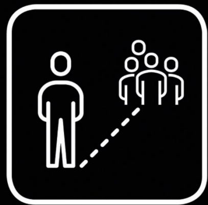
Ausreichend Abstand zu fremden Personen einhalten Keep a sufficient distance away from other people