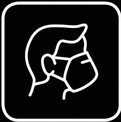
Mund-Nasenschutz tragen Wear a face mask

Für ein gutes und sicheres Miteinander vor und während der Seilbahnfahrt bitten wir Sie folgende Verhaltensanweisungen einzuhalten!